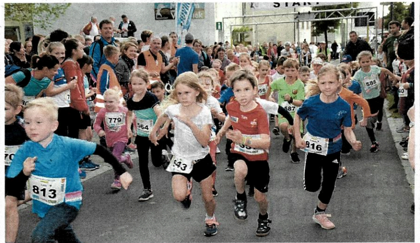
Start. Die Kinderläufe waren sehr gut frequentiert. Daher herrschte im Start- und Zielbereich direkt vor dem Rathaus in Neckenmarkt schon früh ein reges Treiben.