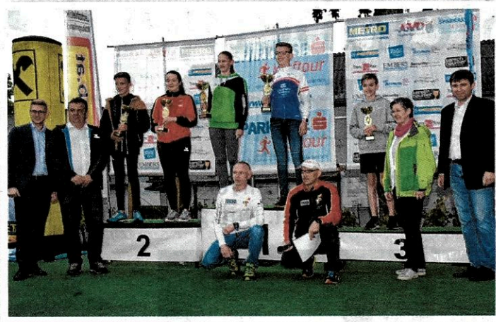
Siegerehrung. Den Siegern beim Fahnenschwingerlauf in Neckenmarkt (hier, U16-Siegerehrung) wurde ein würdiger Rahmen geboten.

465 Teilnehmer, 460 Finisher – tolle Zahlen. Der 2. Fahnenschwingerlauf des LMB lockte Laufbegeisterte aus ganz Ostösterreich sowie jede Menge regionale Prominenz in die Rotweingemeinde. Die BVZ war für Sie dabei.