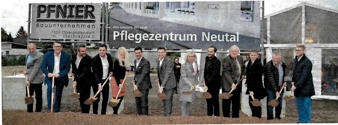
Der Spatenstich gegenüber vom kürzlich eröffneten Platz der Arbeit ging im Beisein aller Beteiligten über die Bühne.